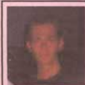
Mr. Gb al centro delle polemiche estive