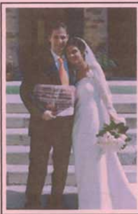
Mr. Romagnoli con la moglie nel giorno delle loro nozze

R: C'è poco da dire, la proposta è stata fatta ed era anche allettante