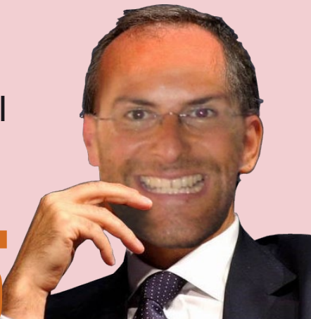
Il Presidente RoncuZZi "Lotittizzato"